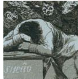
ÁMBITO 6. PANORAMA 9. TRISTES PRESENTIMIENTOS DE LO QUE HA DE ACONTECER.

El mayor legado artístico de las consecuencias de estos hechos que desembocaron en la Guerra de la Independencia, queda reflejado en la serie Los desastres de la guerra de Francisco de Goya.