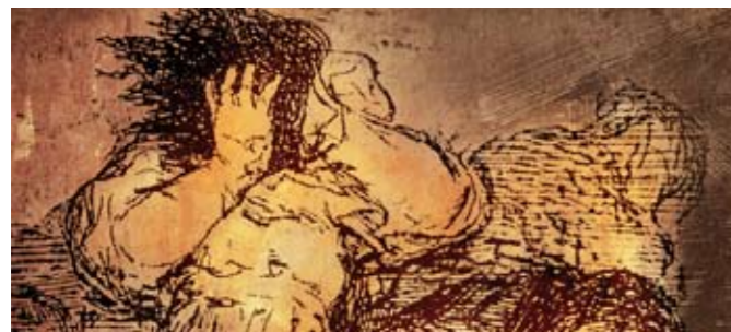
ÁMBITO 6. PANORAMA 8. LA NOCHE TRISTE.

También el pueblo de Madrid ha sufrido las consecuencias de la brutal represalia ordenada por el mando francés. La desolación e impotencia de los ciudadanos se refleja en esta representación.