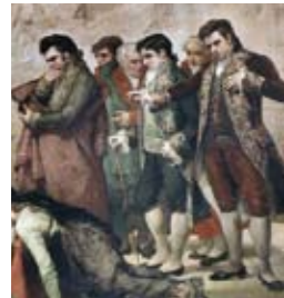
ÁMBITO 6. PANORAMA 7. LA VELA DE LOS HÉROES.

Este panorama marca el inicio del final; las dramáticas consecuencias de la represión francesa. Los militares españoles que han defendido con su vida la defensa